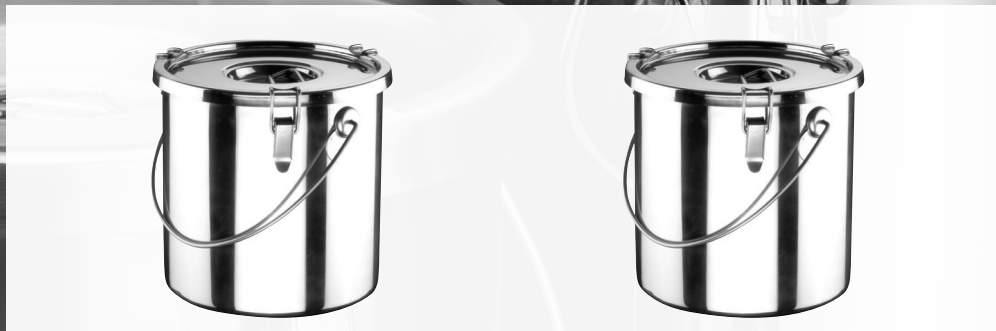
Food Carrying Container, S/S / Conteneur Isotherme Cylindrique Inox