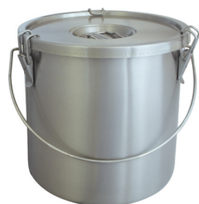
Food Carrying Container Double Skin, S/S Conteneur Isotherme Cylindrique Inox Double Paroi

with sandwich bottom induction ready avec fond "sandwich" compatible avec l'induction