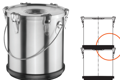
Food Carrying Container Double Skin with Rubber Protection, S/S Conteneur Isotherme Cylindrique Inox Double Paroi avec Protection En Caoutchouc